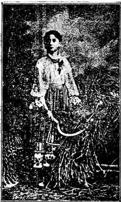
Rămas singur în salon, m'am apropiat de portretul ei care strălucea din ramă în port oltenesc, la vârsta de 15 ani, cu doi ani înainte de a o cunoaște.

Rămas singur în salon m'am apropiat de portretul ei care strălucea din ramă în port oltenesc, la vârsta de 15 ani, cu doi ani înainte de a o cunoaște. Contemplaî mult timp pe olteanca cu snopul într'o mînă cu secerea în cea-laltă în adorațiune mută. Simțeam cum