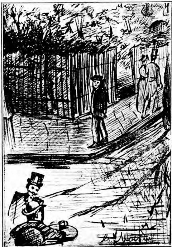
Întorsei capul și ce-mi vizură ochii !