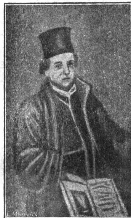
ION CREANGĂ, diacon (după «Șezătoarea» VI, 1901)