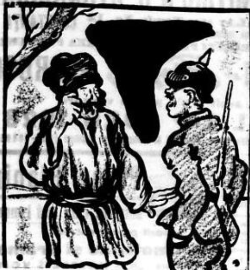
ȚARANUL: — Ce mai e cu voi, camarade, c'auzi că v'a schimbat legea? JANDARMUL: — Legea da, dar n'aravul ba!