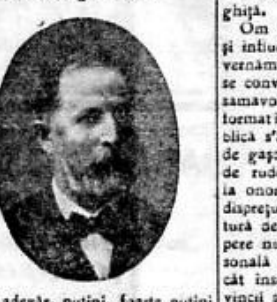
Unul din preștii care au condus la înmormântare

Telefonul ziarului nostru poartă numărul 49/3.